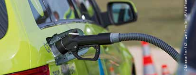
© Mercedes Benz, F-CELL World Drive 2011, USA, auf Flickr